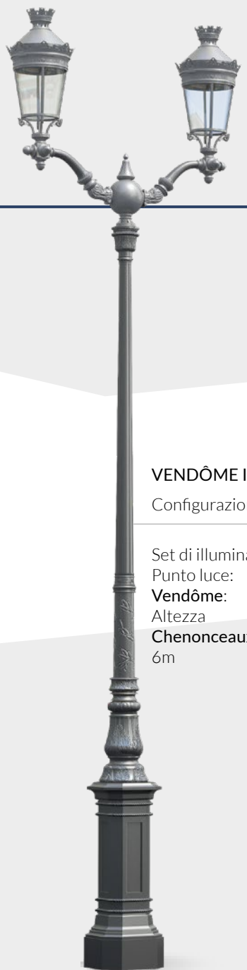
VENDÔME I Configurazione Set di illuminazione: Punto luce: Vendôme: Altezza Chenonceaux III: 6m