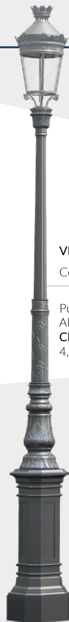
VENDÔME I Configurazione Punto luce: Altezza Chenonceaux III: 4,63m