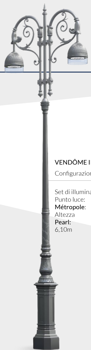
VENDÔME II Configurazione Set di illuminazione: Punto luce: Métropole: Altezza Pearl: 6,10m