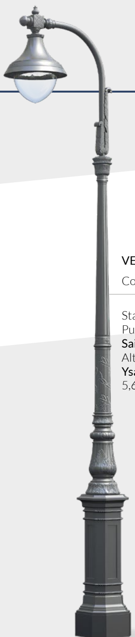
VENDÔME II Configurazione Staffa: Punto luce: Saint Germain I: Altezza Ysalis C1: 5,60m