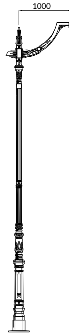
RIVOLI set di illuminazione Saumur