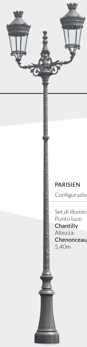
PARISIEN Configurazione Set di illuminazione: Punto luce: Chantilly Altezza: Chenonceaux III: 5,40m