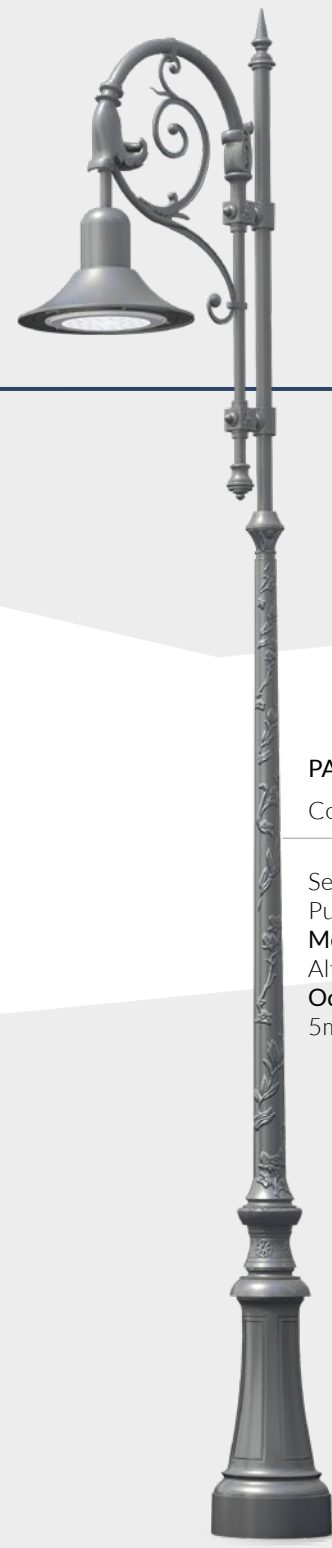
PARISIEN Configurazione Set di illuminazione: Punto luce Metropole 1: Altezza: Odelia 670: 5m