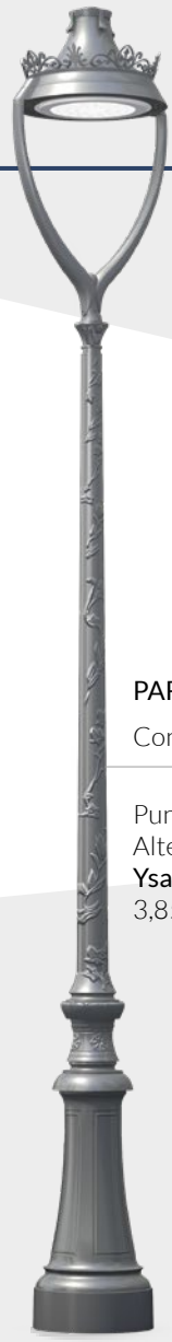
PARISIEN Configurazione Punto luce: Altezza Ysalis lyre C3: 3,85m