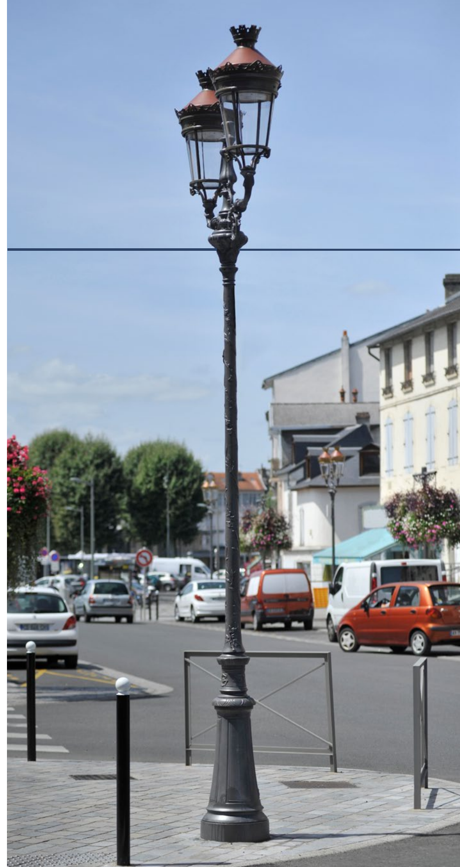
PARISIEN Versione parapetto