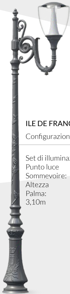
ILE DE FRANCE Configurazione

Set di illuminazione: Punto luce Sommevoire; Altezza Palma: 3,10m