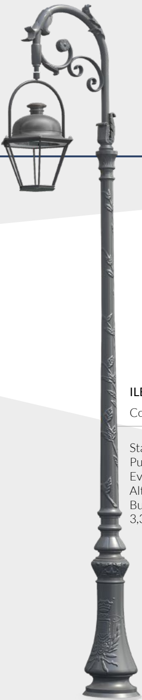
ILE DE FRANCE Configurazione

Punto luce: Altezza Beauregard II: 2,90m