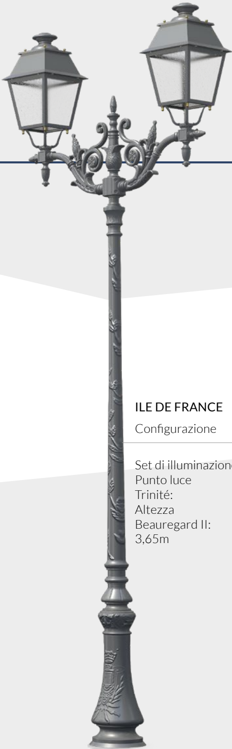
ILE DE FRANCE Configurazione

Set di illuminazione: Punto luce Sommevoire; Altezza Palma: 3,10m