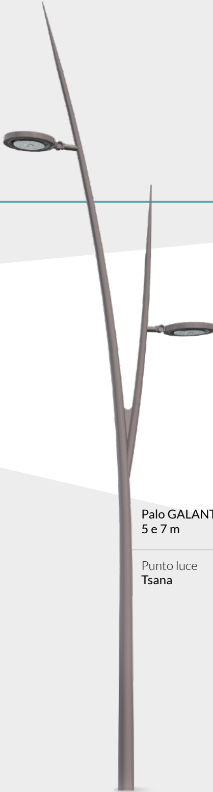
Palo GALANT 2C 5 e 7 m