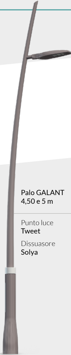
Palo GALANT 4,50 e 5 m