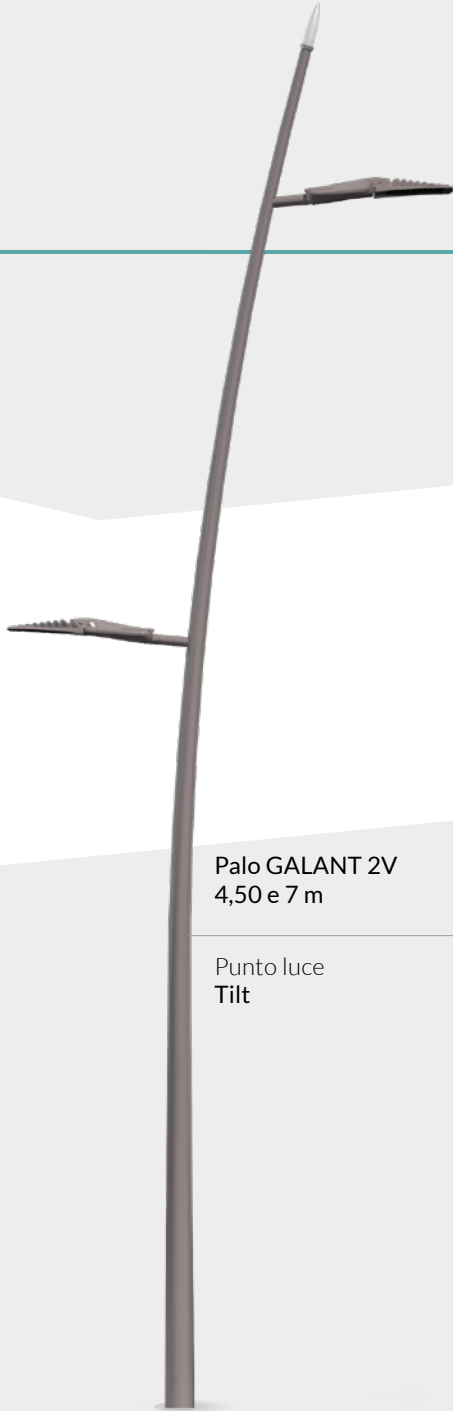
Palo GALANT 2V 4,50 e 7 m