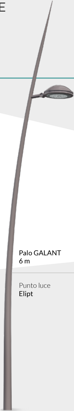
Palo GALANT 6 m