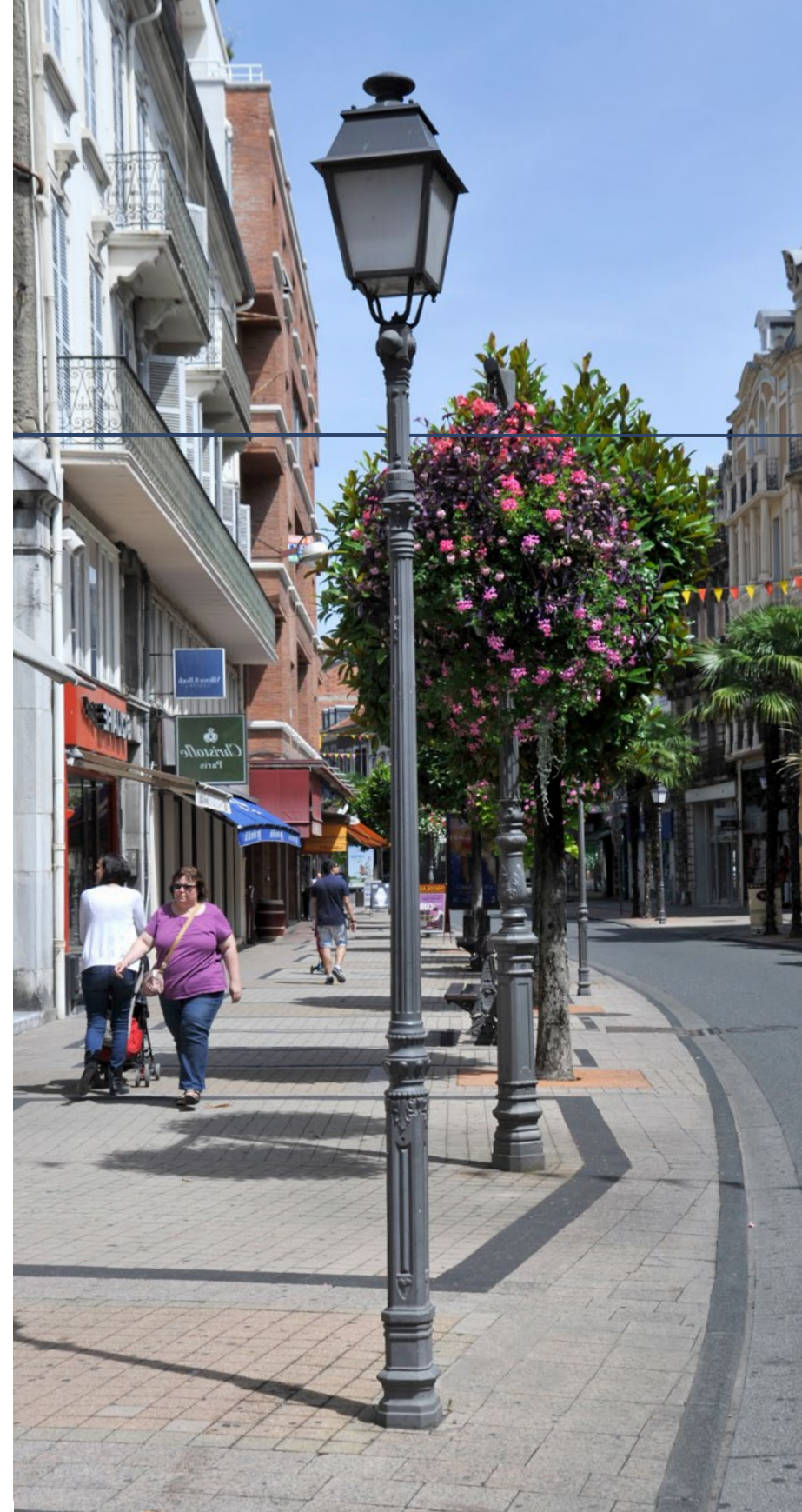
DIRECTOIRE Versione parapetto